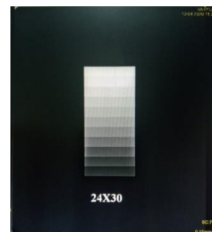
Gambar 2. Hasil citra radiografi kaset ukuran CR 18 cm × 24 cm