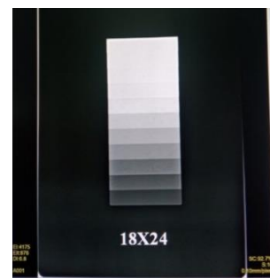
Gambar 1. Hasil citra radiografi kaset ukuran CR 18 cm × 24 cm

Hasil keempat citra radiografi dinilai dan dievaluasi secara subyektifitas dengan parameter yaitu ada dan tidaknya noise , ada dan tidaknya artefak, ada dan tidaknya efek benturan fisik pada hasil citra radiografi CR, dan pengaruh adanya artefak pada penegakkan diagnosa. Hasil citra radiografi dari 4 kaset CR adalah sebagai berikut: